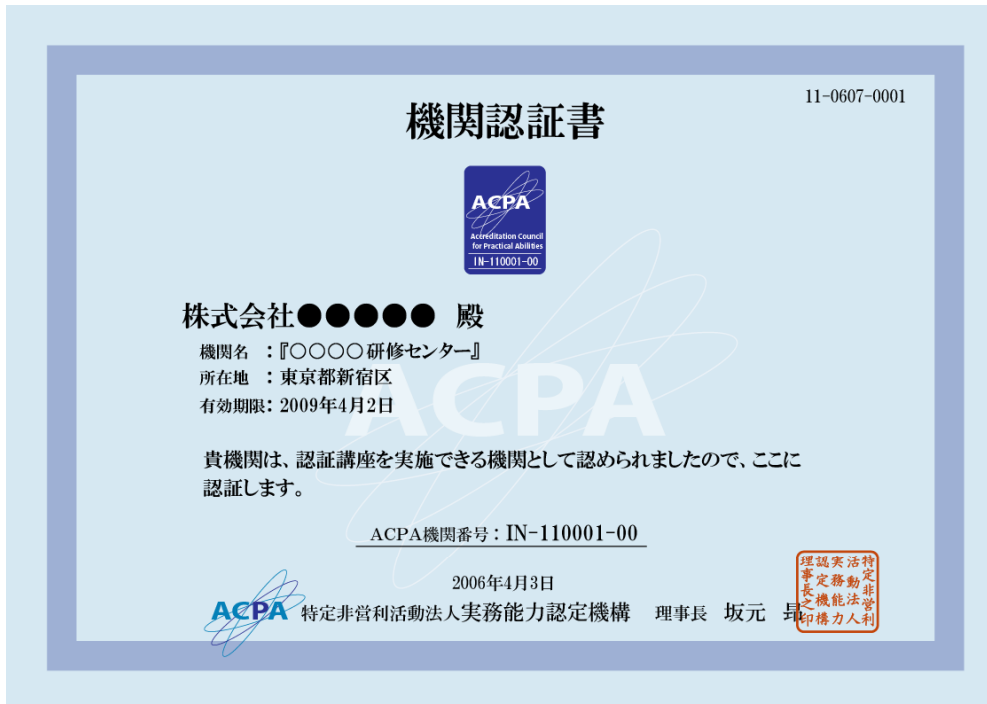
図 4 機関認証書 ( 講座実施 )